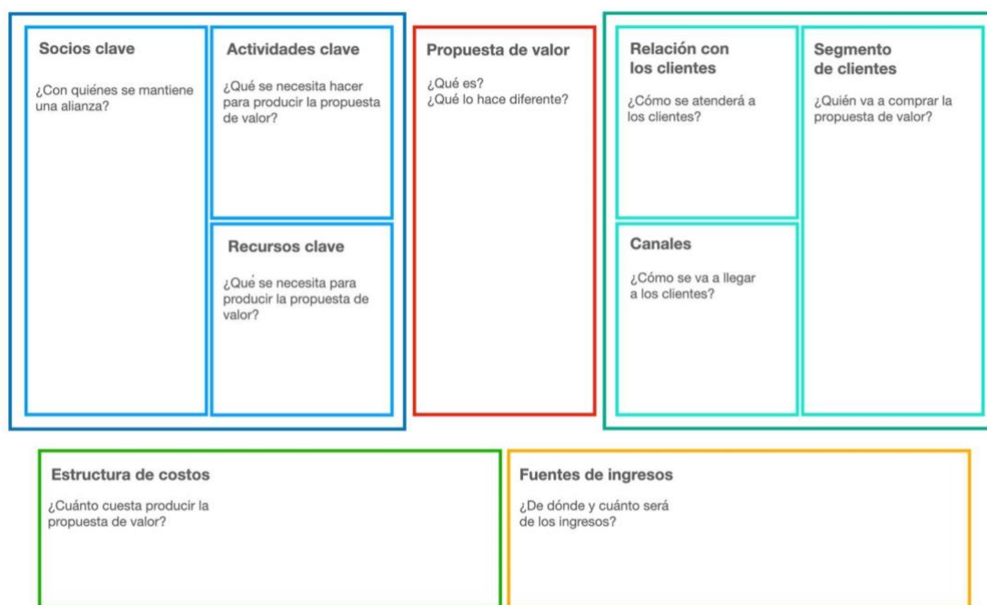
Figura 1 Modelo Canvas

La segunda vertiente de la Feria del Joven Emprendedor fue la elaboración de un Plan de Negocio , el cual se caracteriza por planificar una idea de emprendimiento principalmente para Micro, Pequeñas y Medianas empresas (MiPyMe). Consiste en describir el producto o servicio tomando en cuenta la producción, comercialización y las estrategias necesarias para el cumplimiento de objetivos de la empresa. Toma en consideración los recursos humanos y materiales, así como un análisis de mercado y financiero. El plan de negocio es un documento en el que de manera clara, precisa y sencilla se muestran los resultados de una planificación; es una guía para un negocio porque detallan los objetivos que se tienen y las actividades necesarias para lograrlo (Weinberger Villarán, 2009).