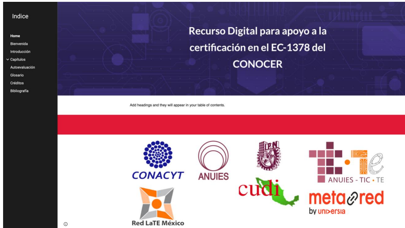
Imagen del capitulado en la plataforma virtual